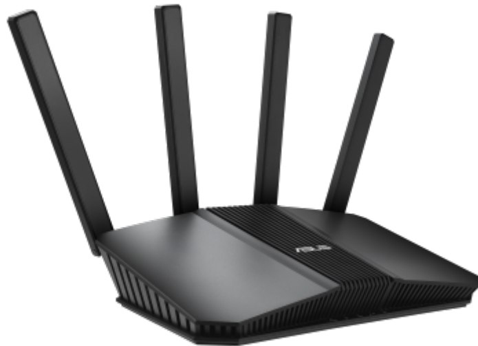
Routeur Wifi Asus RT BE58U

Le protocole de routage interne EIGRP (Enhanced Interior Gateway Routing Protocol) , principalement utilisé par les routeurs Cisco