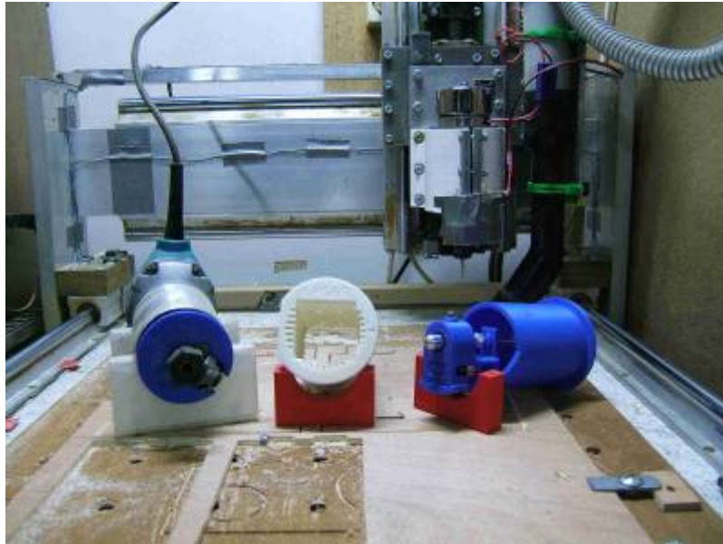
-3- détail de l'axe X