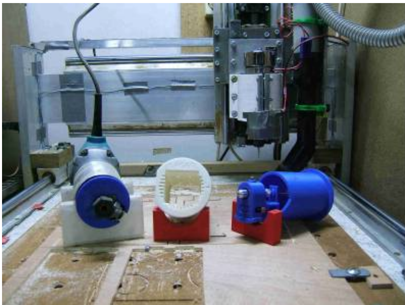
-3- détail de l'axe X