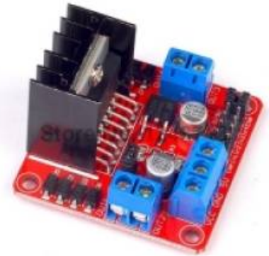
Carte de contrôle des moteurs (L298N – « double pont en H ») :