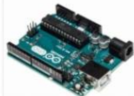
Broches D5 et D10 PWM obligatoirement

ATTENTION Le borne moins (la masse) est commune. Il faut brancher la borne moins de la batterie et la borne moins de l'arduino sur la borne moins du Driver Moteur