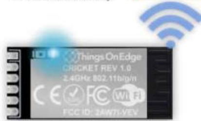
IOT Cricket Wi-Fi module