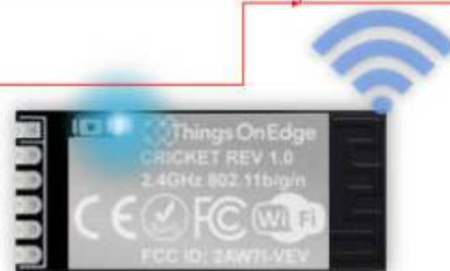
IOT Cricket Wi-Fi module