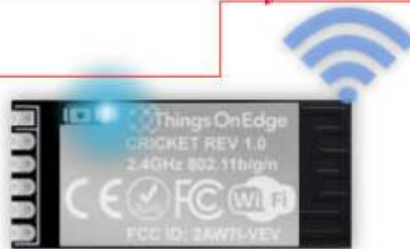
IOT Cricket Wi-Fi module

Vous pouvez maintenant commencer à configurer Cricket (voir la section CONFIG ) et le configurer pour envoyer des données aux appareils clients : smartphone, ordinateur portable, PC, ... Pour en savoir plus sur la façon de recevoir des données de Cricket sur les appareils clients, rendez-vous dans la section API de communication .