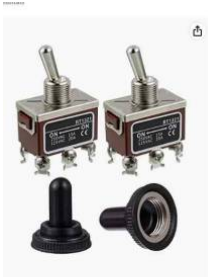
Passez la souris sur l'image pour zoomer